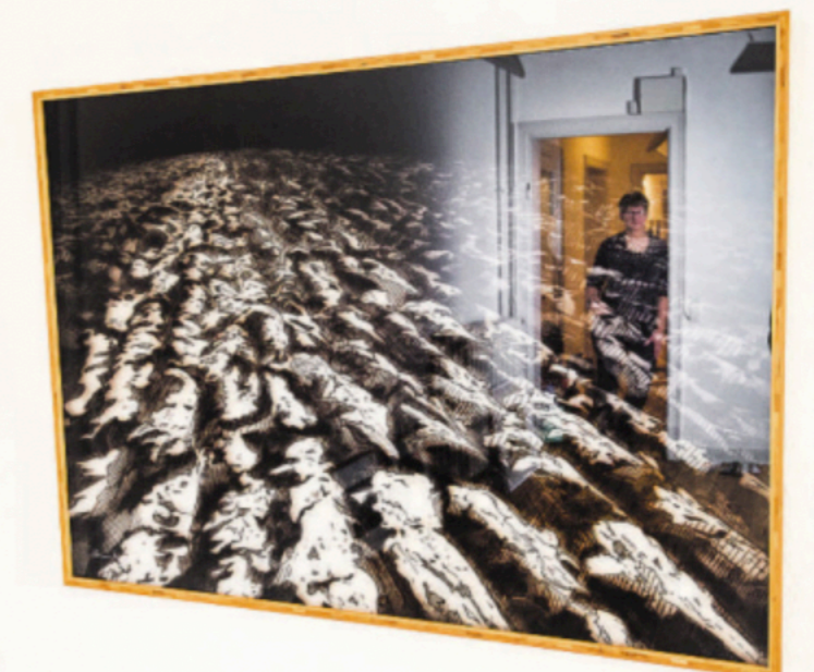
Marker og muld er det store tema inspireret af nationalromantikken.