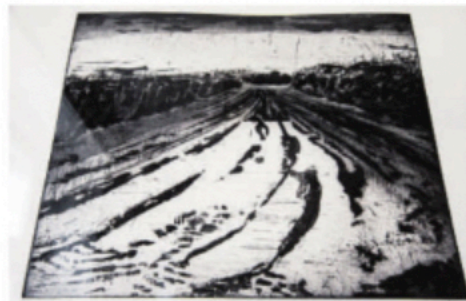
En klassisk grafik lavet med forskellige ætsninger. Værket har titlen "Sporene udviskes".