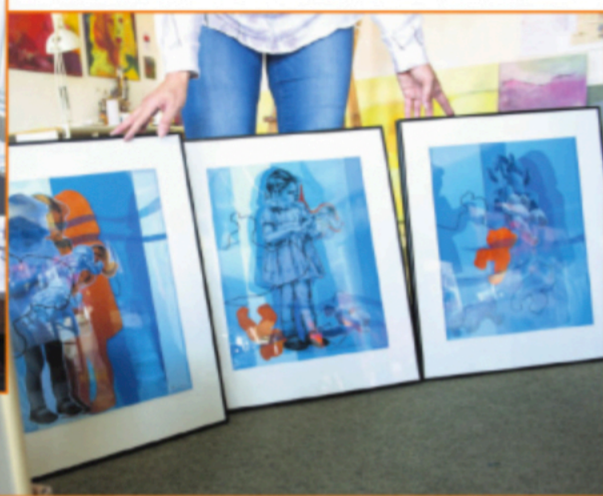
"Dukkeleg" er titlen på en udtryksfuld og stærk følelsesladet grafisk fortælling.